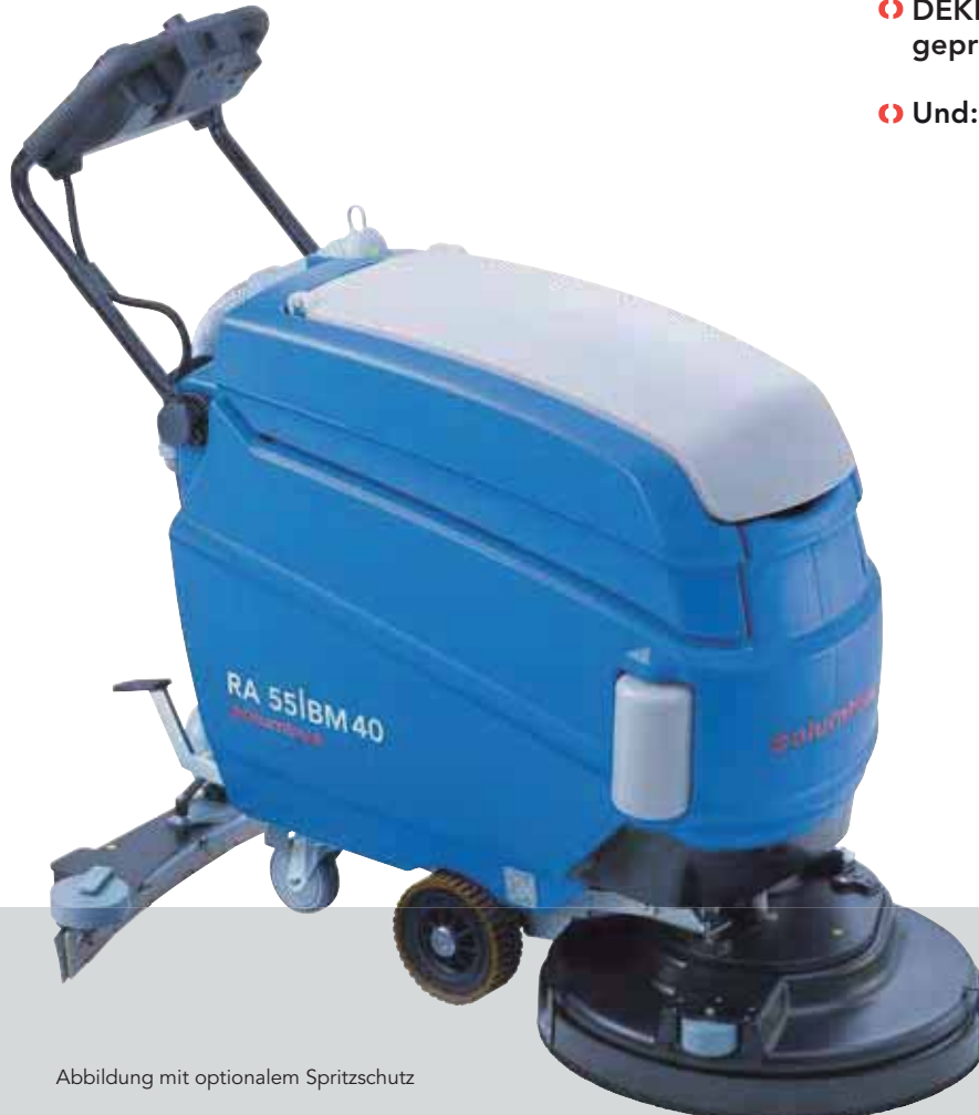
Abbildung mit optionalem Spritzschutz