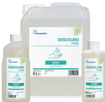
DESCOLIND PURE WASH