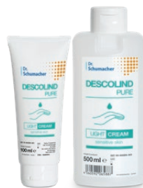
DESCOLIND PURE LIGHT CREAM