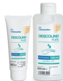
DESCOLIND PURE INTENSIVE CREAM